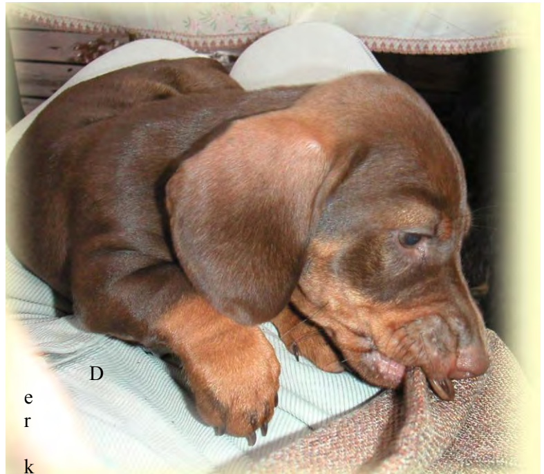
leine Buddha „Nogger“ meditiert meinen Jackenknopf.