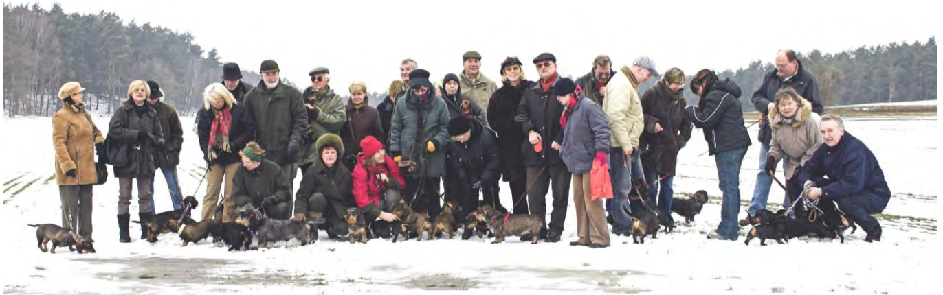
Es gibt ja immer Welche, die nicht aufs Bild wollen! Wir waren wirklich 30 „Spazierer“

herbei und zog die Karre aus dem Dreck! Wie schön, daß wir auch immer wieder Gäste begrüßen können, vielen Dank für diese Hilfe!