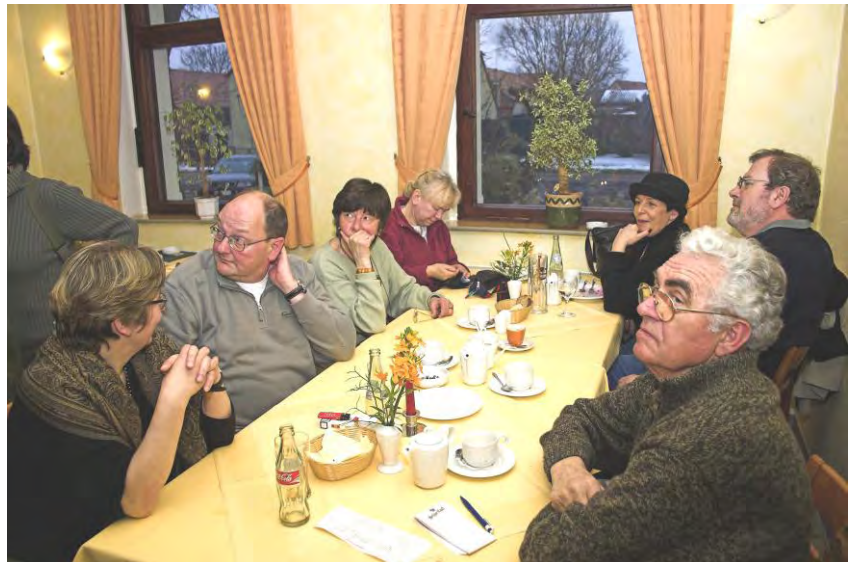
Kuchen oder Waffeln, das ist hier die Frage!