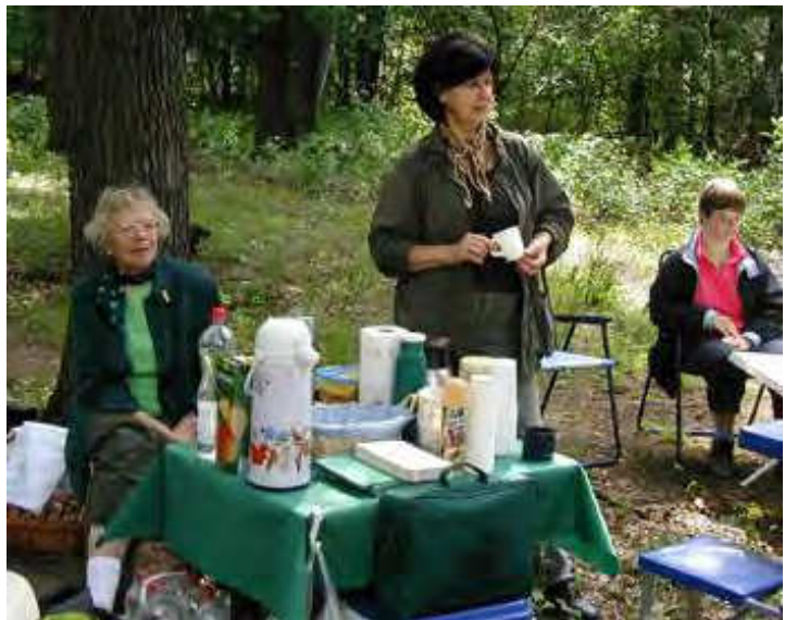
Das Büfett wartet auf die Prüflinge!

Wie immer wurden wir von anderen Hundebesitzer aus der ferne bestaunt, aber nicht einer kam mal fragen was wir da eigentlich machen, auch gut.