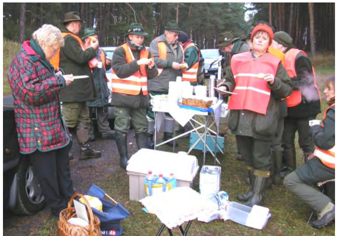
Marketenderei im Mini Format, geschmeckt hat es dennoch!