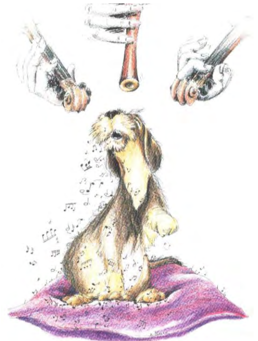
» Aus dem Buch „Bekenntnisse eines Dackels“, Schluffi bei der Hausmusik!